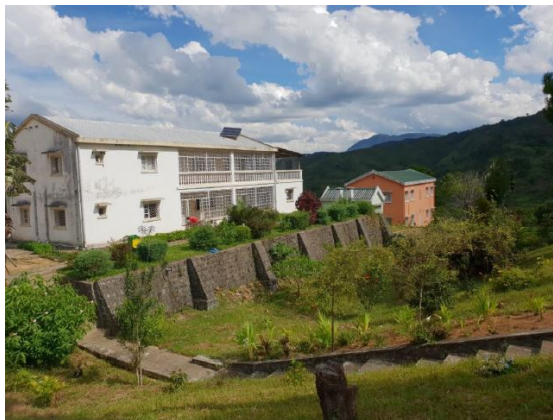
Le Centre de Santé de Safata

En ce qui concerne les cas de COVID, Madagascar dans l'ensemble a été assez épargnée. Pour les cas confirmés positifs il y en a eu seulement 5 à Akamasoa dont 1 personne qui